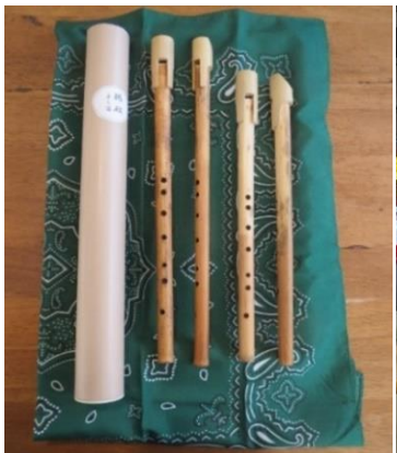
よし笛(ケースとC、D管)