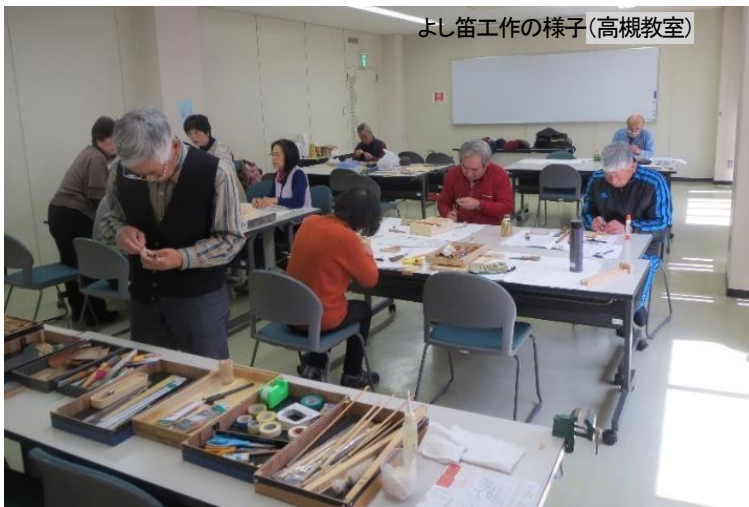
よし笛工作の様子(高槻教室)

詳細はホームページ 鶉殿よし笛 ( http://yoshibesalon.web.fc2.com/ ) をご覧ください。