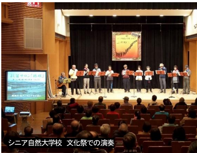
シニア自然大学校 文化祭での演奏

よし笛演奏グループも、高槻市に2、島本町1、京都市2、宇治市にも1グループ結成され毎年11月に「よし笛秋の集い」合同演奏会を開催しています。その他地域の公民館主催の発表会、有志による病院での演奏会など楽しみながら活動しています。昨年2月7日のシニア自然大学校主催第1回文化祭での演奏も楽しい思い出です。昨今のコロナ騒動で活動も休止状態ですが、早くおさまリ再開ができるよう願ってやみません。