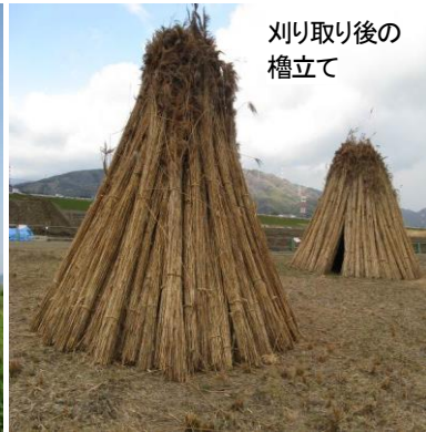
刈り取り後の 櫓立て

講座生の野外実習でヨシ刈り体験をされた方はご記憶にあると思いますが、高槻市上牧の淀川中洲には鶉殿ヨシ原が広がっており、多種多様な動植物の生息地としても知られています。ヨシは全国に自生していますが、このヨシは肉厚、良質で雅楽の箏篋用リードとして古くから唯一使用されているものです。